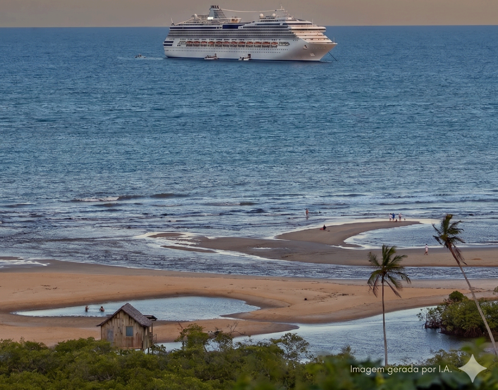
Imagem gerada por I.A.